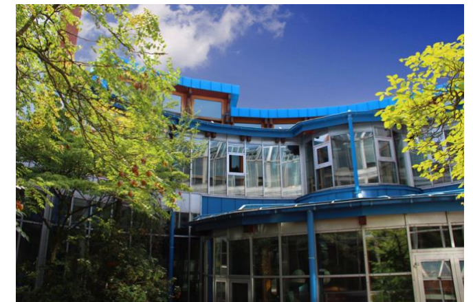
Schulträger: Landkreis Rastatt