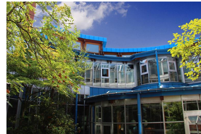
Schulträger: Landkreis Rastatt